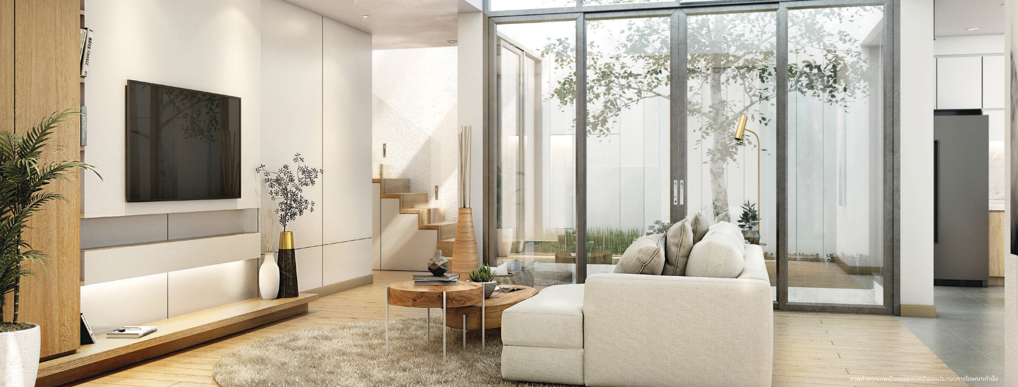
ภาพถ่ายทุกภาพเป็นบรรยากาศจำลองประกอบการโฆษณาเท่านั้น