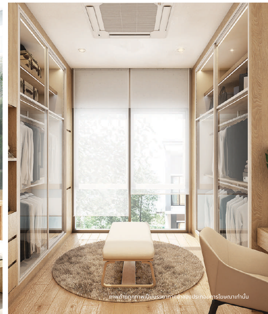
ภาพถ่ายทุกภาพเป็นบรรยากาศจำลองประกอบการโฆษณาเท่านั้น