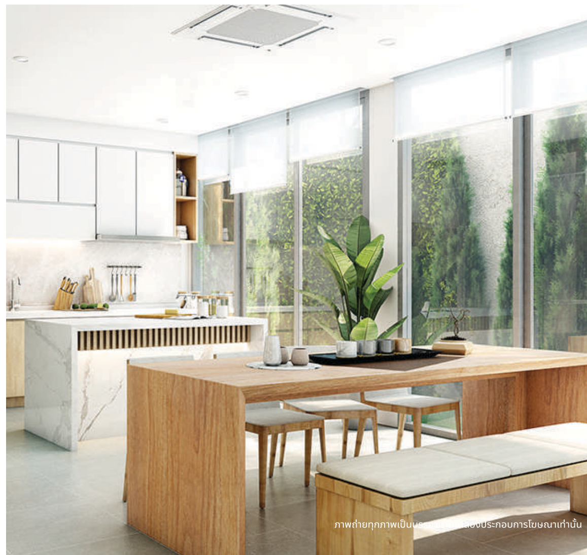
ภาพถ่ายทุกภาพเป็นบรรยากาศจำลองประกอบการโฆษณาเท่านั้น

ทุกฟังก์ชันจึงถูกออกแบบจากแนวคิดความสัมพันธ์ระหว่างชีวิตและบ้าน คุณจะพบกับการพักผ่อนที่เชื่อมต่อกับธรรมชาติในทุกพื้นที่ และชีวิตในบ้านที่ง่าย สะดวกสบาย กับระบบ Smart - home ทั้งหลัง